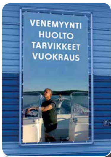
Seinäteline MMP 2200 x 3200 mm Mainoskangas 1800 x 2800 mm (Tuote 26810)