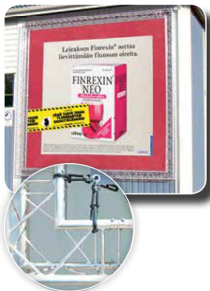
Seinäteline mainostrussi 4800 x 4800 mm Mainoskangas 4160 x 4160 mm (Tuote 26833)